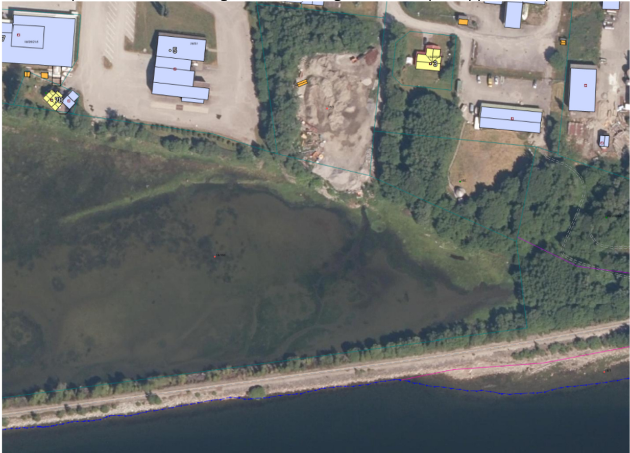
Figur 2 Flyfoto kart viser strømmer på havbunnen

Figur 2 viser flyfoto kart med tydelige strømmlinjer på havbunnen som trolig indikerer et bekkeutløp. Det vil være naturlig å vurdere muligheter for å åpne opp bekkeløp her.