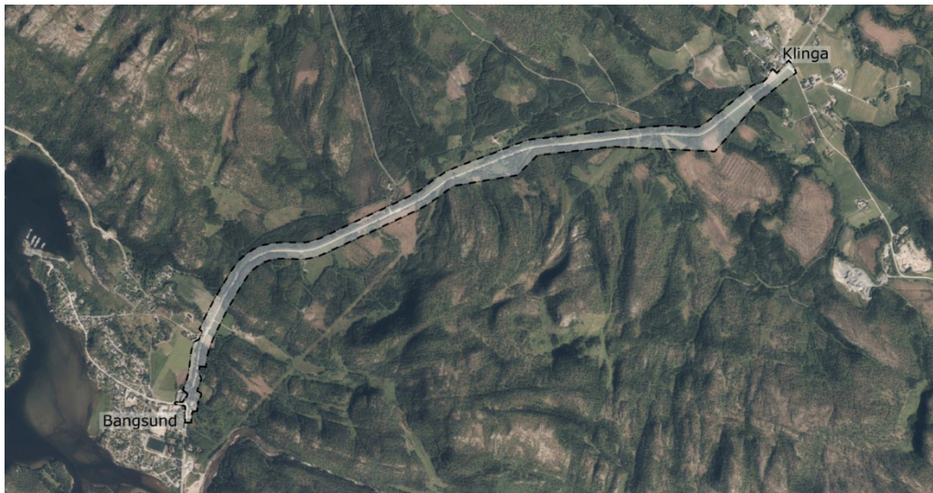
Forslag til planavgrensning (ortofoto)