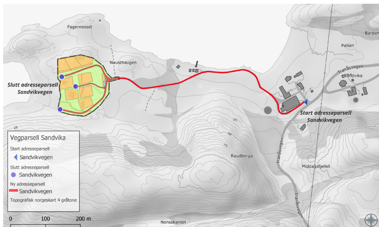
Figur 1: Reguleringsplan Sandvika hytteområde med ny foreslått vegparsell.