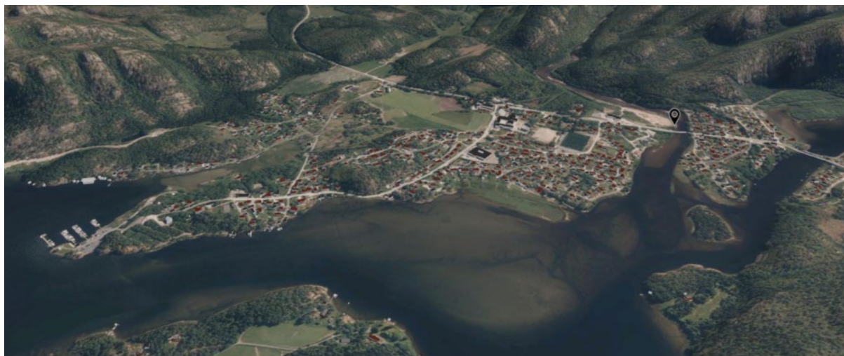
Figur 1 Bangsund oversikt - "Stedet ved vannet"