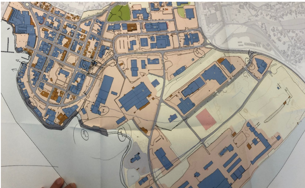
Figur 5: Plassering til forslag i pnkt.1-7.