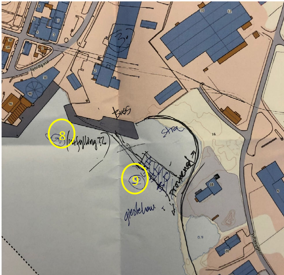
Figur 4: Plassering til forslag i pnkt. 8 og 9.