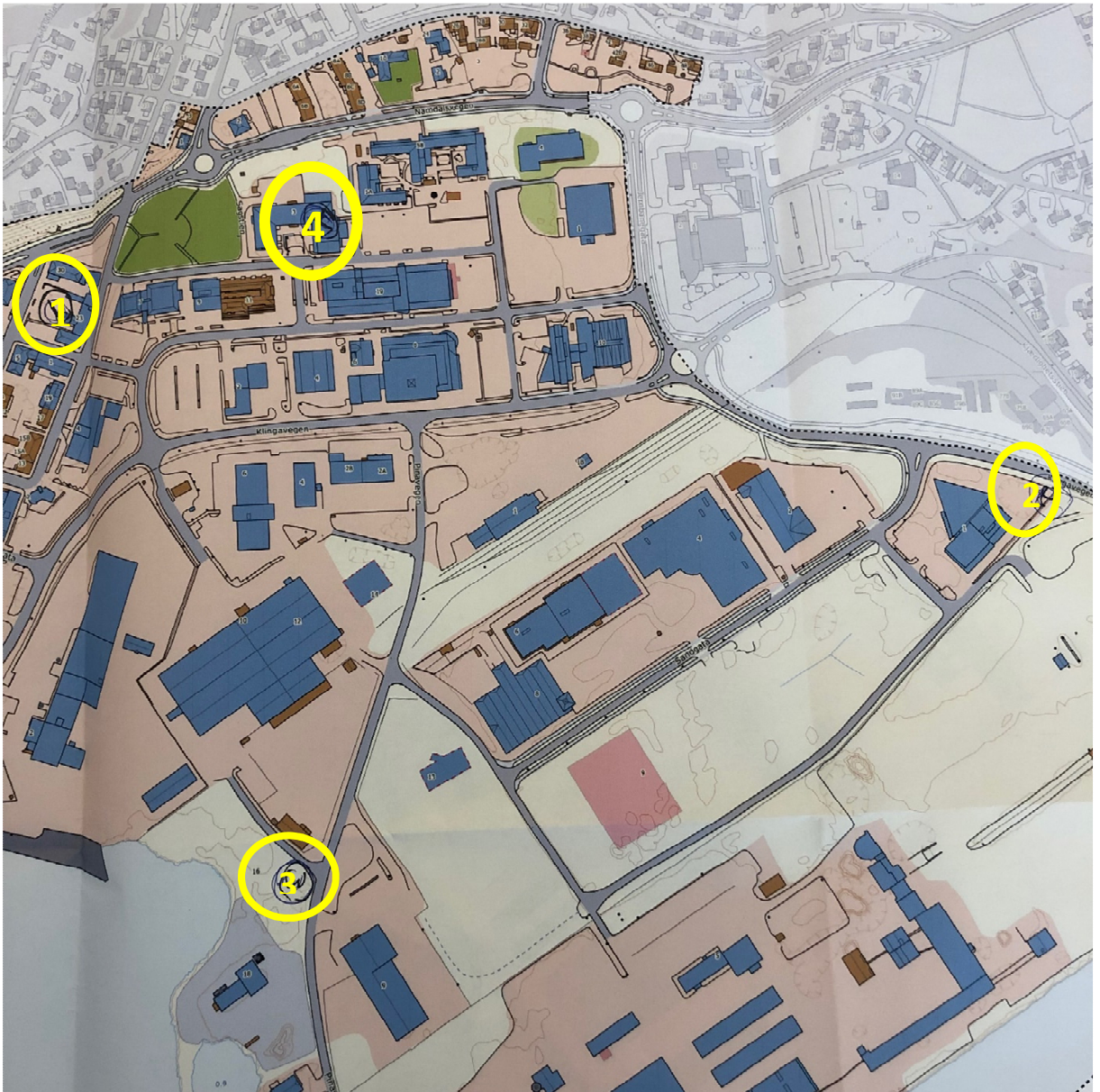
Figur 3: Plassering til forslag i pnkt. 1-4.