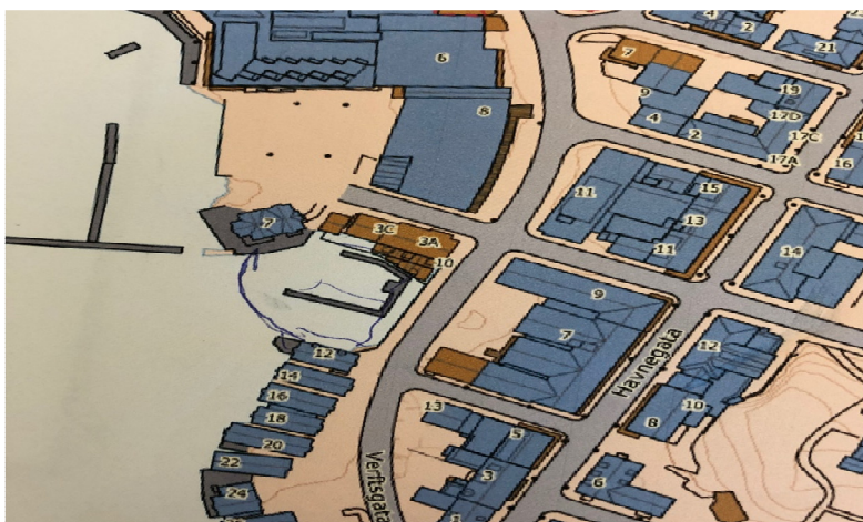
Figur 1: Bru Bråholmgata-Verftsgata pnkt. 4.