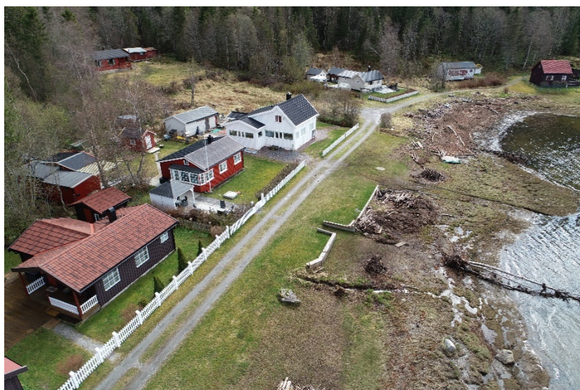
Figur 3: Inngangstrase til hyttefeltet