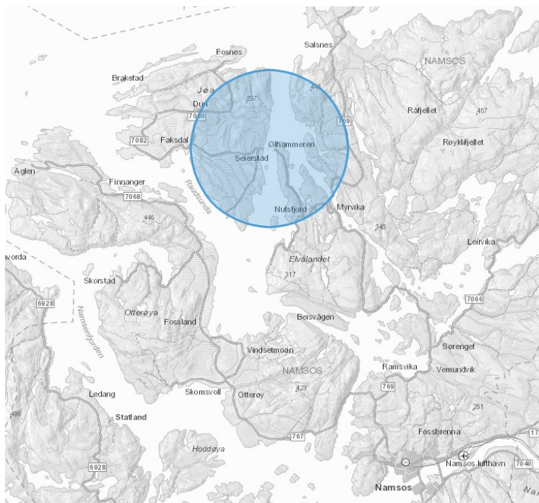
Kartskisse over dagens ferjesamband til Jøa i Namsos kommune

Fylkestinget vedtok i oktober 2018 å etablere prosjektet Jøa t'land 24/7. Et prosjekt med ambisjon å utfordre industri og kompetansemiljø i hvordan fjordkryssing mellom fastlandet og øya Jøa kan løses på en bedre måte enn i dag.