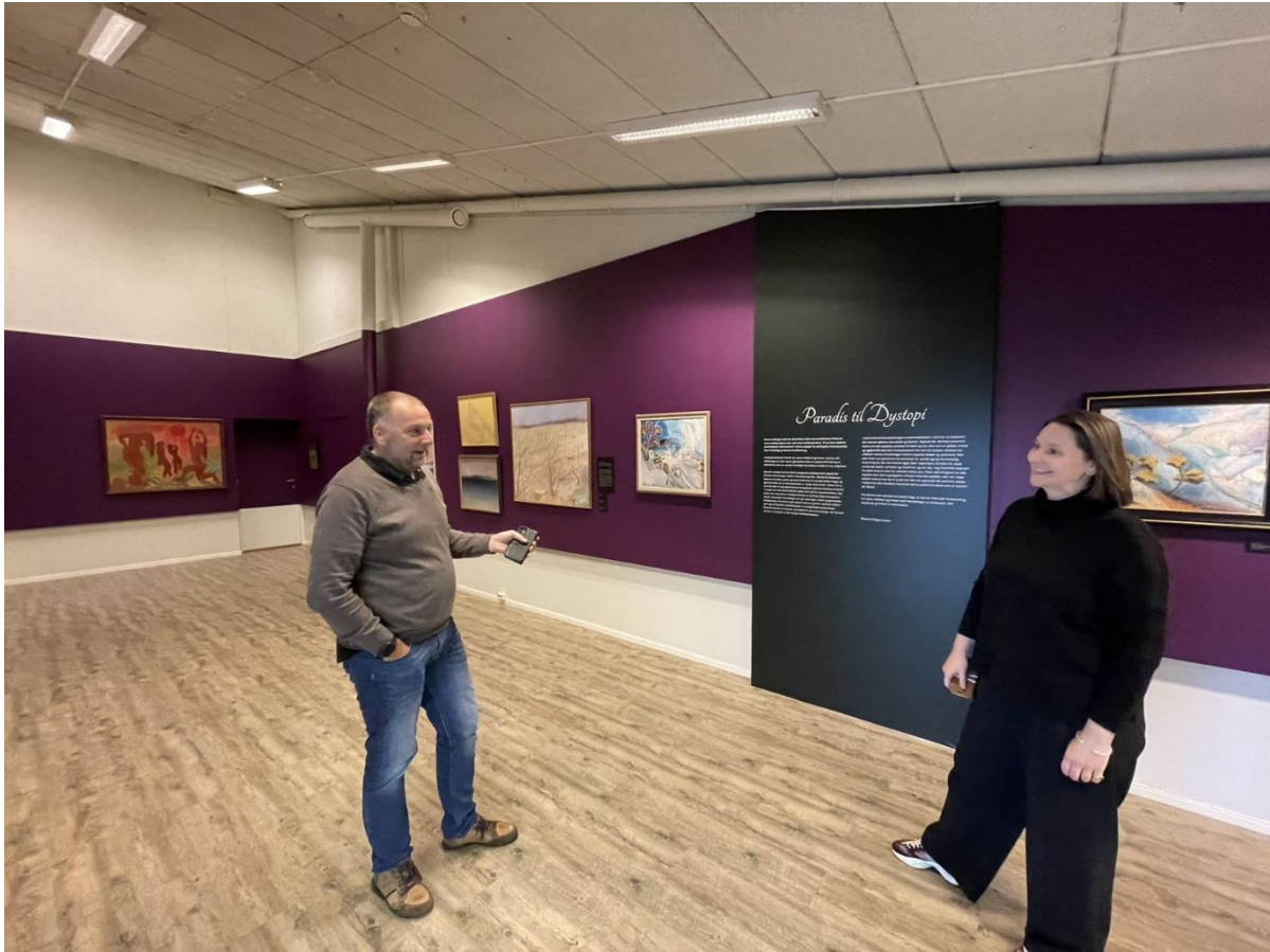
Figur 15 Riangalleriet. Lydgjennomgang fra salen virker sjenerende.

Kunstheis med direkte adkomst mellom magasin og utstilling er svært positivt, selv om den ideelt sett skulle vært noe større.