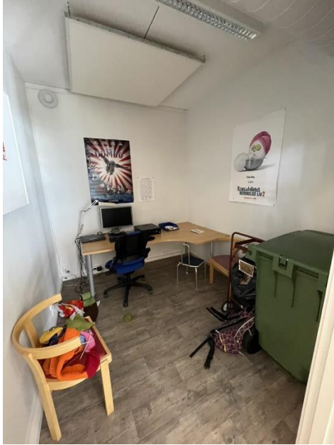
Figur 10 Stillerom/nødkontor i biblioteket/innbyggertorg