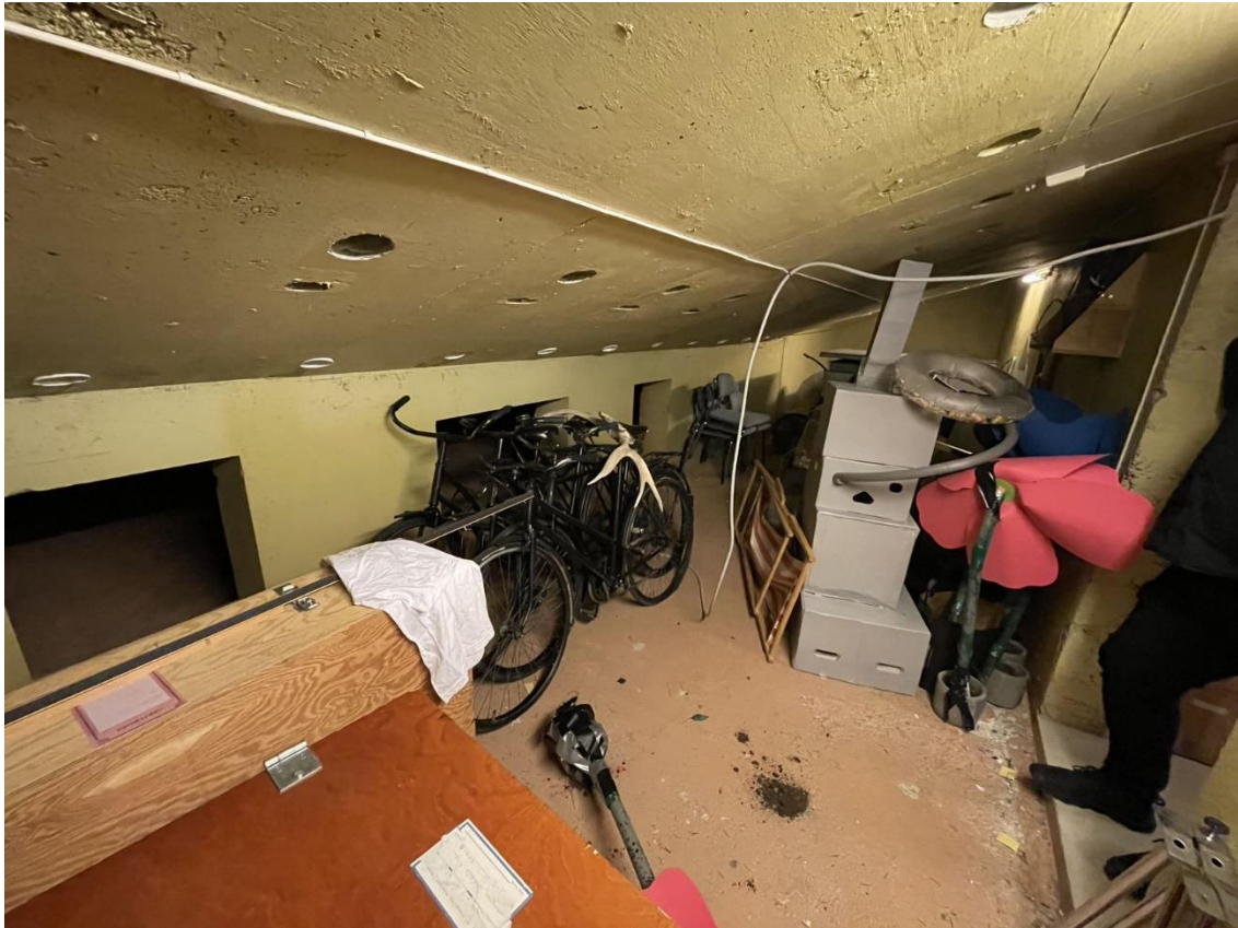
Figur 8 Lager under amfi