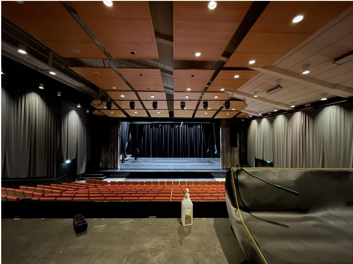
Figur 4 Oversiktig mikseposisjon

Plasseringen på midten, bakerst i salen gir god oversikt over salen. Det er imidlertid trang adkomst bak mellom stolradene og ikke hev/senk pult.