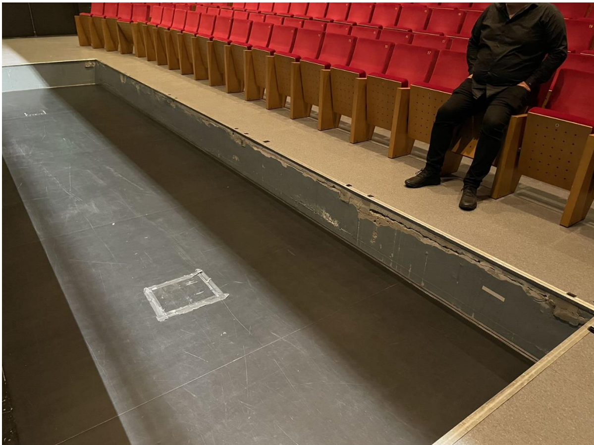
Figur 3 Orkestergrav

Setene er plassert i et amfi med 356 faste seter. I bakkant av salen er det 4 rullestolplasser. Kulturhusets driftsorganisasjon opplever at dette normalt ikke er et kapasitetsproblem. Men det er ikke usannsynlig at ved enkelte forestillinger vil det reelle behovet være større. I tillegg er det ved spesielle arrangementer muligheter for et antall rullestoler i forkant av scenen når orkestergraven/forscenen ikke er i bruk. Dette er imidlertid krevende mtp evakuering og krever stor bemanning.