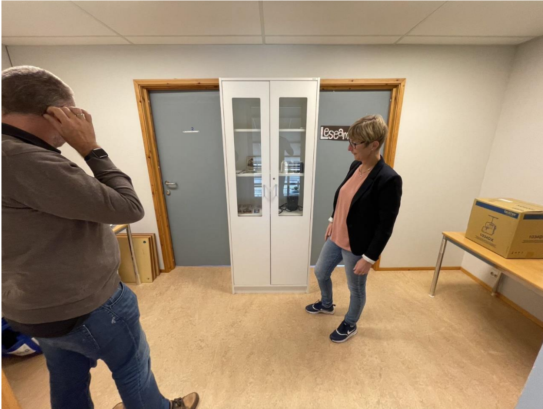
Figur 11 Tilgjengelige arealer for folkeverkstedet

Tilgjengelig areal er svært begrenset og det mangler infrastruktur som vann og avløp. Plassering også at det kan bli sjenerende støy for studieplass og kontor som ligger like innenfor.