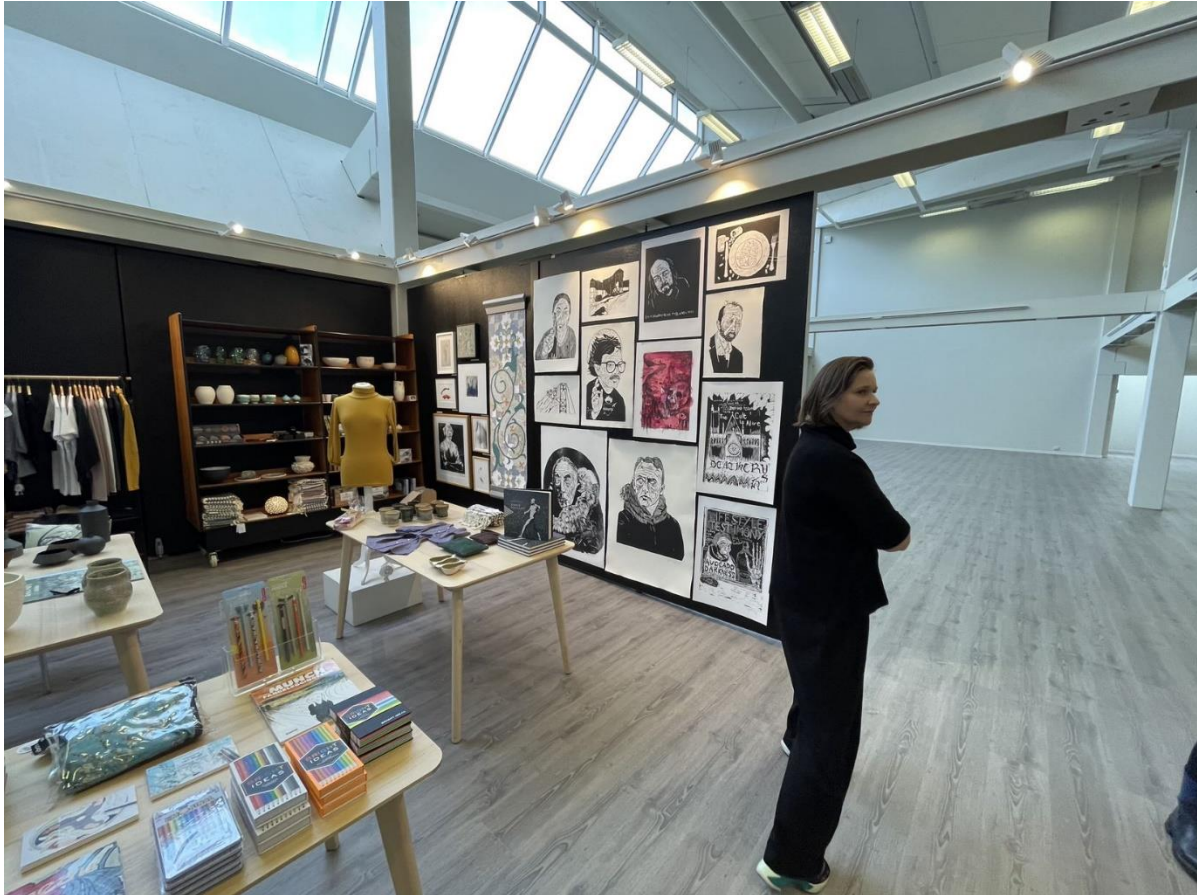
Figur 12 Museumsbutikken

Salg av effekter har blitt stadig viktigere i finansiering av formidling av kultur. Kunstmuseet har en butikk i sine lokaler som ligger bak vinbaren Barrique. Museumsbutikken mangler lager i rimelig nærhet, og er ikke synlig fra hovedinngangen.