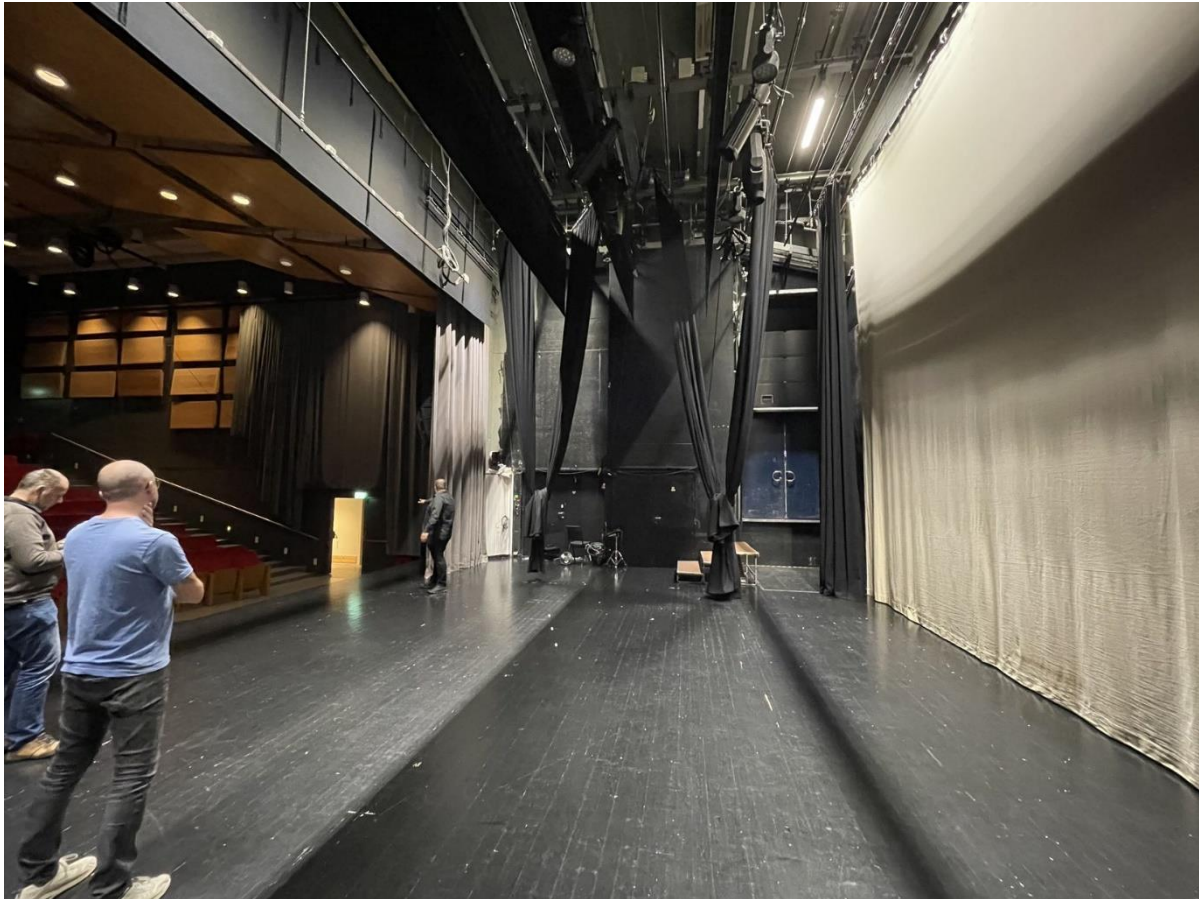
Figur 5 Scenerommet

Scenetrekkene har svært liten løftekapasitet. De har også grunnet skrått tak begrenset løftehøyde som gir få muligheter mtp kulissebruk. Fraværet av sidescene gjør det siste mer til en teoretisk begrensning, men ville være reelt ved en utvidelse med sidescene. Scenetrekk vil ikke bli godkjent av krankontrollen, og planlegges byttet i 2022.