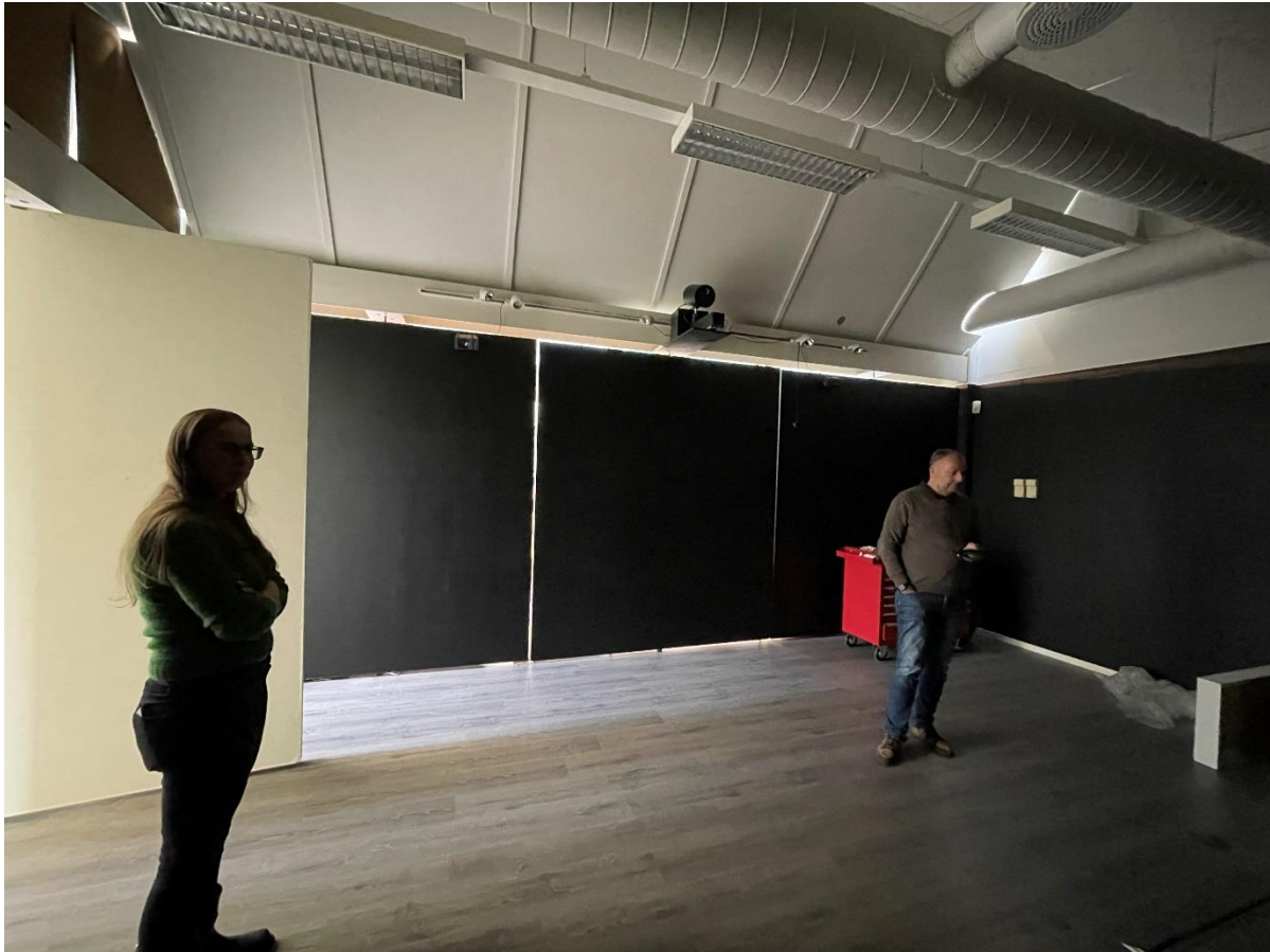
Figur 14 Avlukke i utsillingsarealet, forsøk på blanding.

Stort innslipp av dagslys og ventilasjonsanlegg uten mulighet for kontroll av temperatur og luftfuktighet utgjør en sikkerhetsrisiko for utstilte verker, og det er dermed også begrensinger på innlån. Dagslys er positivt i en arbeidsplass eller i en sosial setting, men for produksjon av utstillinger er UV-stråling skadelig for verkene og skiftende lysforhold gjør komposisjon av utstillinger krevende. I tillegg til behov for kontroll av dagslysinnslipp er det også et preserverende behov for oppgradering av belysning, både mtp lyskvalitet og ikke minst styringsmuligheter. Mulighet for lysstyring (inkl blanding) er også nødvendig for gode fremvisningsmuligheter for digital kunst.