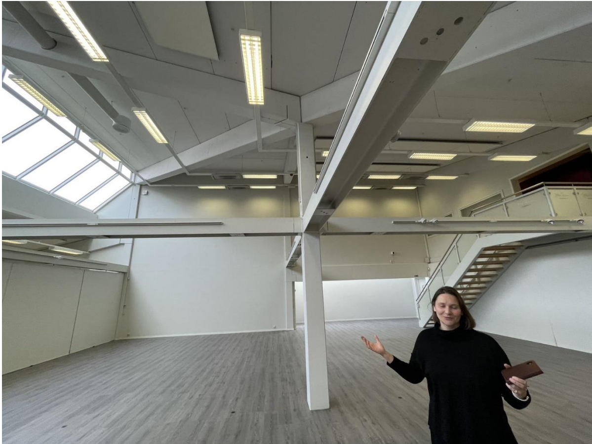
Figur 13 Galleriet. Demonterbare "snurrevegger" gir fleksibilitet, men bæresystemet gir visuell støy i åpen konfigurasjon.

Det er også utfordringer med tanke på akustikk i galleriet. Dette er en gjenganger i store åpne rom med stor takhøyde. Dette kan utbedres ved å øke andelen lydabsorberende himling. Mellom Rian-galleriet og salen er det en del lydgjennomgang som gir begrensninger for samtidig bruk.