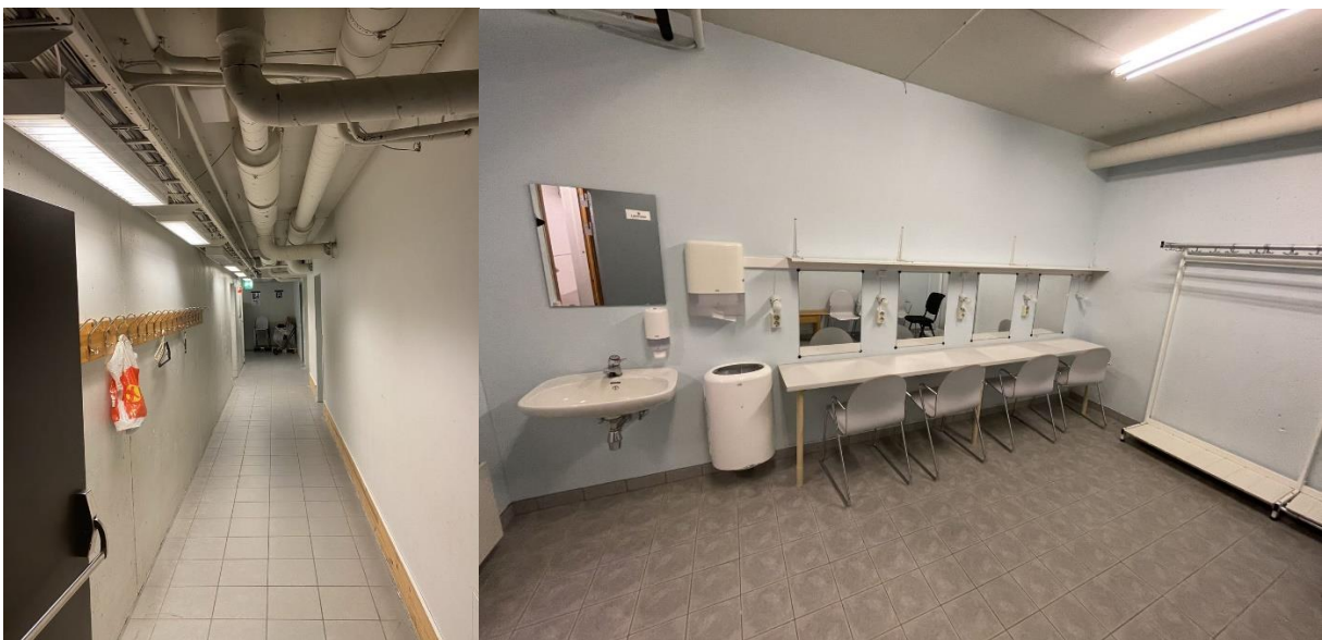
Figur 9 Garderobefasiliteten kan i beste fall kalles spartanske

Garderobene har alt for liten kapasitet, ligger langt fra scenen og har sårt behov for kosmetisk oppgradering.