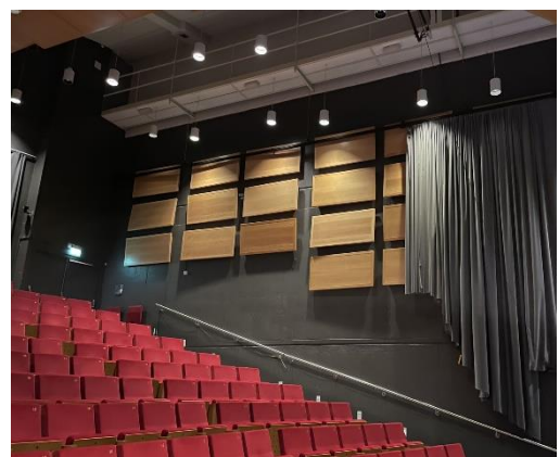
Figur 6 Reflektorer på vegg feil montert etter overflatebehandling.

Lydgjennomgang gjør samtidige arrangementer i salen og galleriet problematisk.