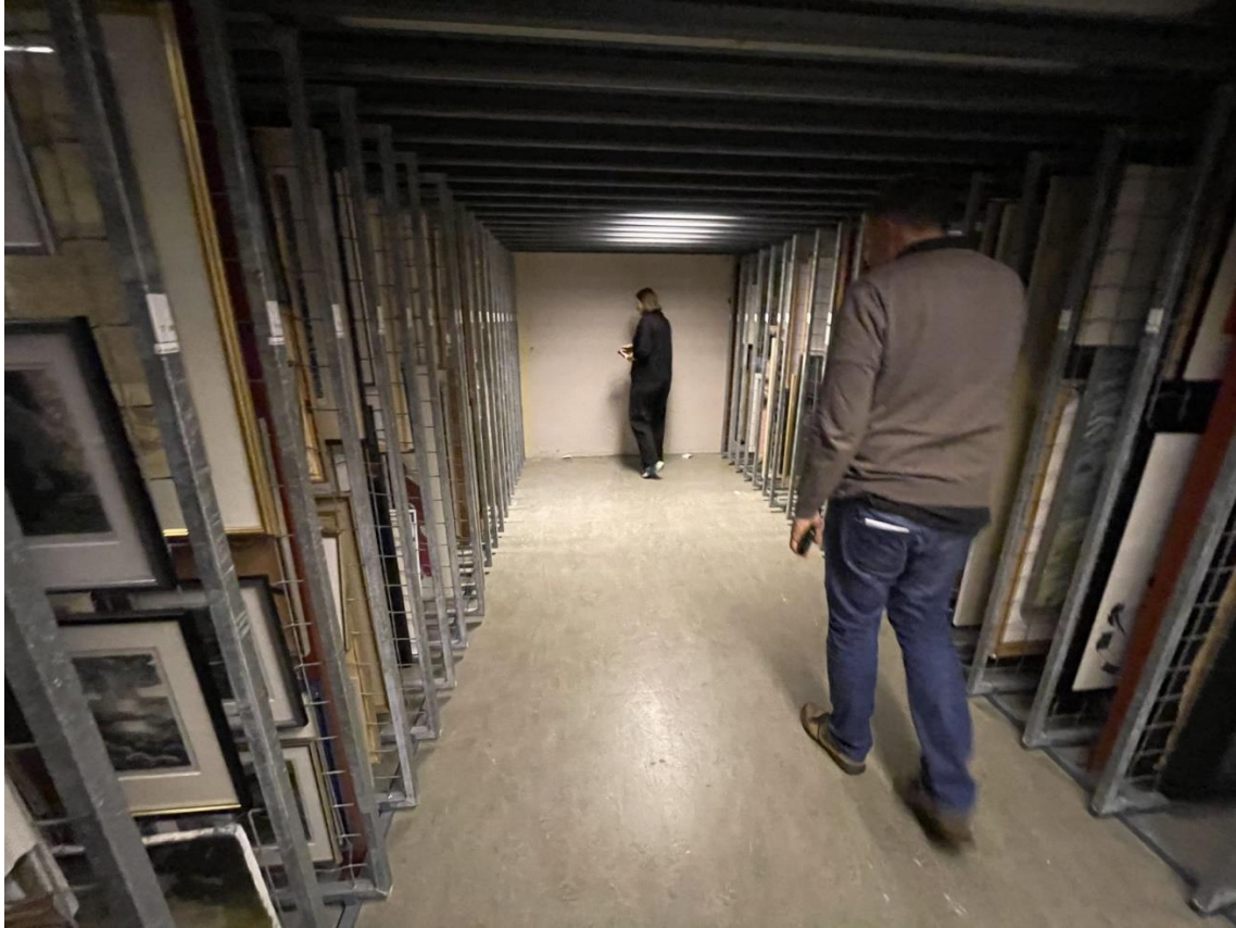
Figur 16 Et av magasinrommene i kjelleren.