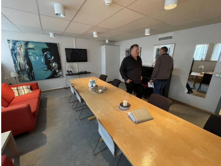
Figur 7 Greenroom

Mangler kjøkken, ikke spesielt god atmosfære, men har i det minste himling.