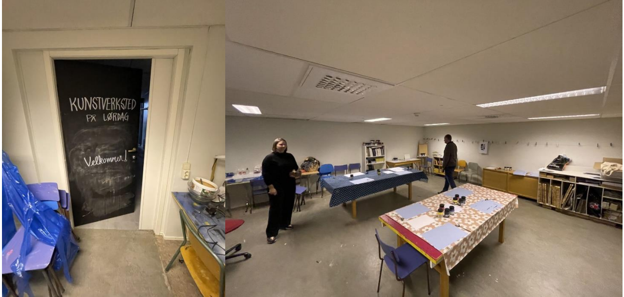
Figur 18 Kunstverksted i kjelleretasjen. Mangler dagslys

Tilgang til verkstedlokaler er viktig for Kunstmuseets drift og virksomhet, og det brukes svært hyppig i formidlingsprogrammet. Lokalet som brukes i dag er ikke egnet for slik virksomhet uten dagslys, uten utsug og god ventilasjon, for lite areal og lite synlig beliggenhet i Kulturhusets gamle garderobe i kjelleren. Dette er fasiliteter som er viktig for videreutvikling av virksomheten, og kan sees i sammenheng med etablering av folkeverksted i biblioteket.