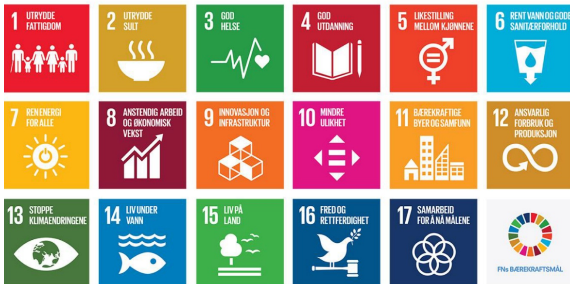
Figur: Illustrasjon av FNs bærekraftsmål

I 2015 vedtok FNs generalforsamling 2030-agendaen for bærekraftig utvikling. De 17 bærekraftsmålene skal fungere retningsgivende for land, næringsliv og sivilsamfunn.