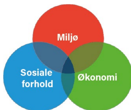
Figur: Illustrasjon av de tre dimensjonene i bærekraftig utvikling

Bærekraftig utvikling handler om å ta vare på behovene til mennesker som lever i dag, uten å ødelegge framtidige generasjoners muligheter til å dekke sine. Bærekraftsmålene reflekterer de tre dimensjonene i bærekraftig utvikling: klima og miljø, økonomi og sosiale forhold.