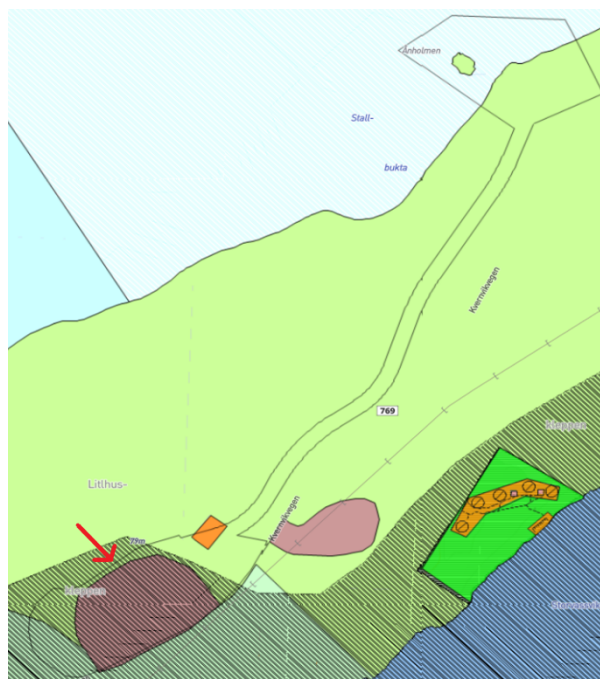
Figur 1: Planområdet, aktuelt masseuttak anvist med rød pil

Eksisterende masseuttak (R3 Masseuttak grus på eiendommen Østtun 271/1) i planområdet er i kommuneplanens arealdel avsatt til område for råstoffutvinning. Området rundt eksisterende masseuttak omfattes videre av sikringssone for rent drikkevann (H110_2 Salvatnet, Kommuneplanens arealdel). Vegen mellom uttaket og kaia ligger i et område med LNFR-formål.