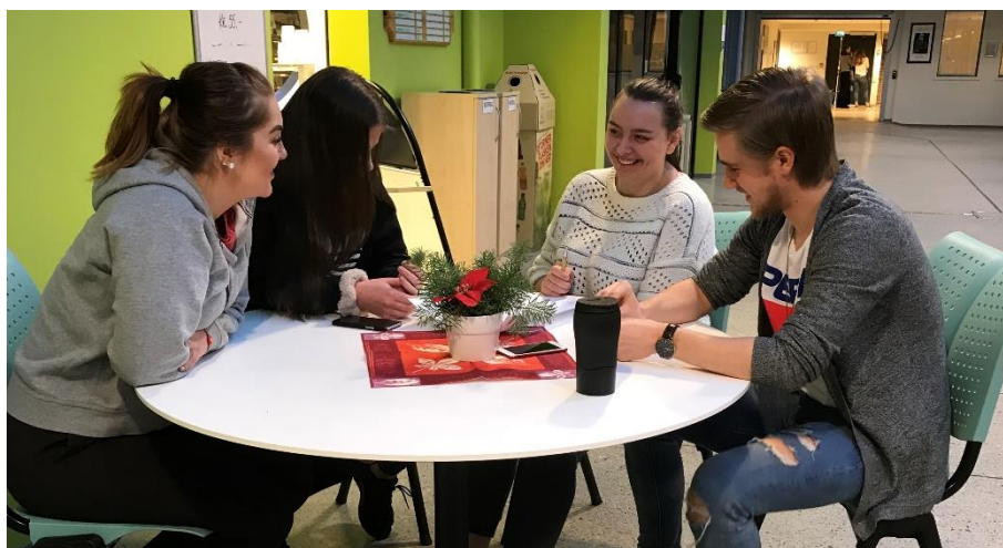
Elever ved Olav Duun videregående skole hadde gruppearbeid og kom med innspill til Nye Namsos den 4. desember 2018.

Læringsplasser og lære-plasser Flere jobbtilbud Bolig i en overkommelig prisklasse Turisme – Rock City – Festivaler og konserter Flere og mer varierte butikker – spre de! Oppussing av byen En trygghet på at det er jobb Nye yrker: hydrogen, havkraft etc. En mer sentrumsnær skole Flere familietilbud (bowling, lekeland etc.) Sommergate/gågate/julegate Bedre veier Flere møteplasser