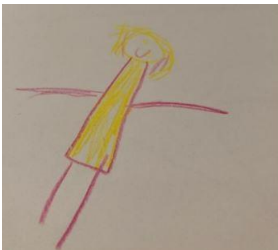
Tegning: Meg som danser.

Dans er en av tematikkene som er fremtredende i materialet. Hvis temaet ikke dukker opp av seg selv i samtalen og vi spør om de liker å danse, kommer responsen med glade tilrop. Dans har derfor fått en egen overskrift. Dans er nært forbundet med musikk også i dette materialet, og en av barna har tegnet lydbølgene som går gjennom luften og setter i gang bevegelsen. De forteller at et av stedene de kan danse er på biblioteket.