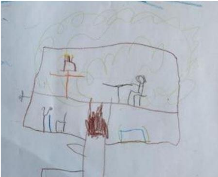
Sitter i trehytta mi, spiser kake, spiller på ipad, bader og ser TV.

Det digitale er ikke veldig fremtredende, men likevel synlig i materialet. Det digitale knyttes til en aktivitet som gjøres hjemme, og barna nevner det å se på TV og ramser opp ulike barneprogram som Paw patrol og Labyrint med Daidalos. De liker også å spille i-Pad og nevner spill som blant annet Super Mario.