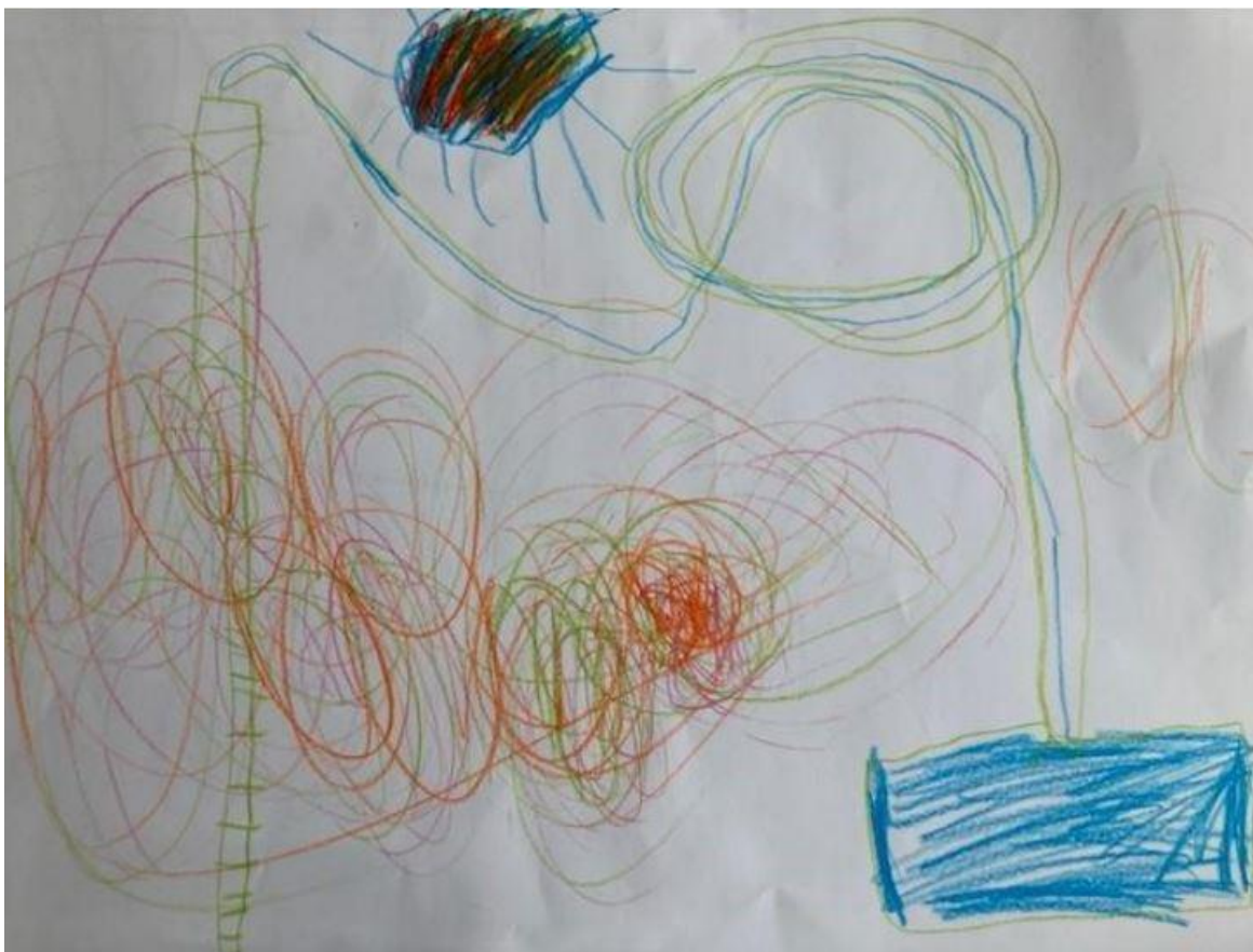
Tegning: Vannsklie med diskolys og basseng.

Skli og bade Bading og sklier forekommer svært ofte sammen både i tegningene til barna og i loggene fra samtalen. Her figurerer høye stiger som fører opp til fantastiske sklier som etter sving og loop ofte ender i et basseng fylt med vann. I samtalen er det tydelig at barna liker å bade. I kaldt eller varmt vann, inne eller ute. Dette er et av temaene som vekker barnas engasjement. Stemningen som oppstår når vi snakker om disse tingene er som oftest høy og gledefylt.