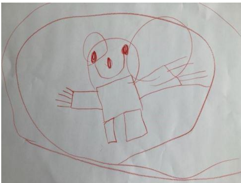
Meg som bader.

Dette er også en arena som barnehagelærerne vi snakker med trekker frem. Biblioteket er et sted å dra med familien eller også sammen med barnehagen. Biblioteket er en etablert arena i lokalsamfunnet som tilbyr et mangfold av kulturelle tjenester, som er synlig i samtale med barna og med barnehagelæreren.